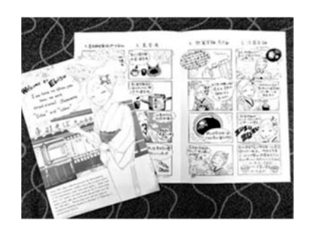
資料1 もてなしの匠 心得帳